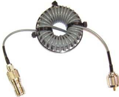
入出力の方向性はありません

HF帯無線機 高インピーダンス タイプ コモンモード・チョーク の完成品です 大型コアの採用、耐熱同軸 1.5D-QEVを使用し、高インピーダンス、高性能、を実現しました HFローバンドの特性が良く 1.8~21MHz帯用におすすめです 特に1.8MHz帯~7MHz帯は高インピーダンスで、受信時のコモンモード・ノイズ低減効果も見込めます